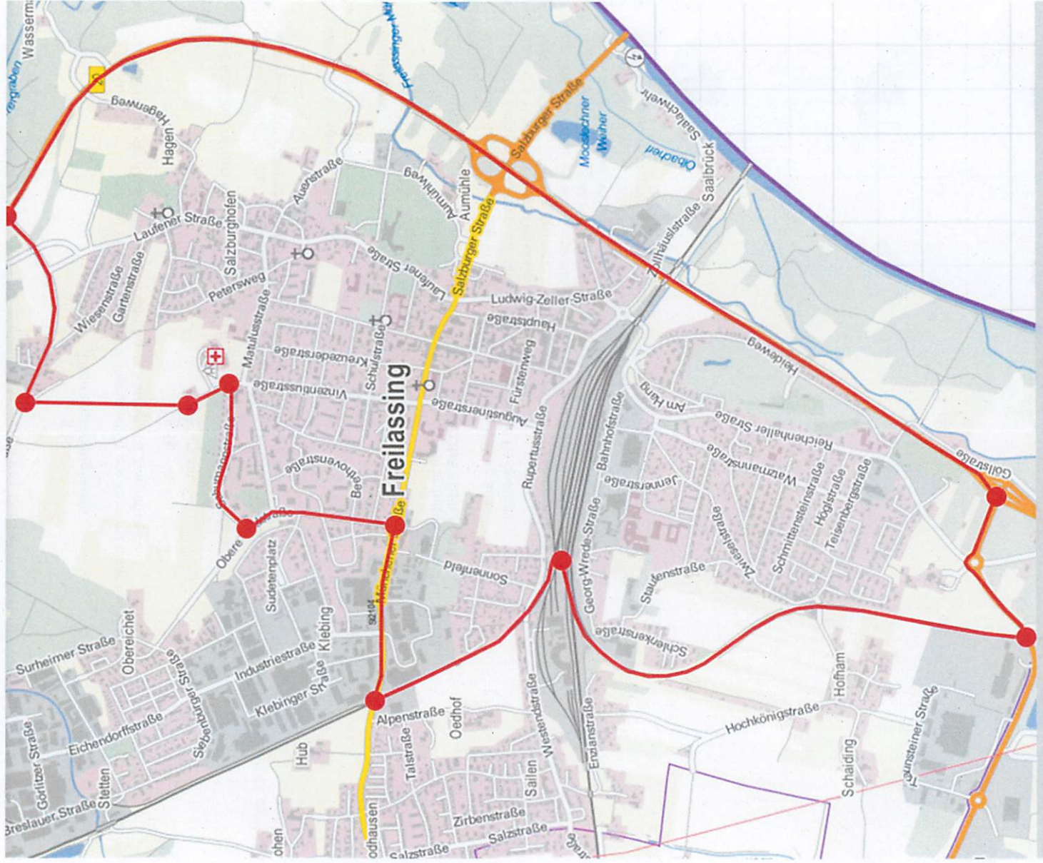
Dieser Plan ist Bestandteil der Verordnung vom 24.06.2022 ANFAHRTSFREIE ZONE BERTCHTESGADENER RAUM